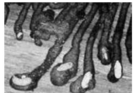
Vom Borkenkäfer befallenes Holz muss jetzt raus aus dem Wald!

Die Waldbesitzervereinigung Holzkirchen steht auch für die Aufarbeitung der restlichen Schadholzmengen mit professionellem Personal und sorgfältig arbeitenden Unternehmern zur Verfügung.