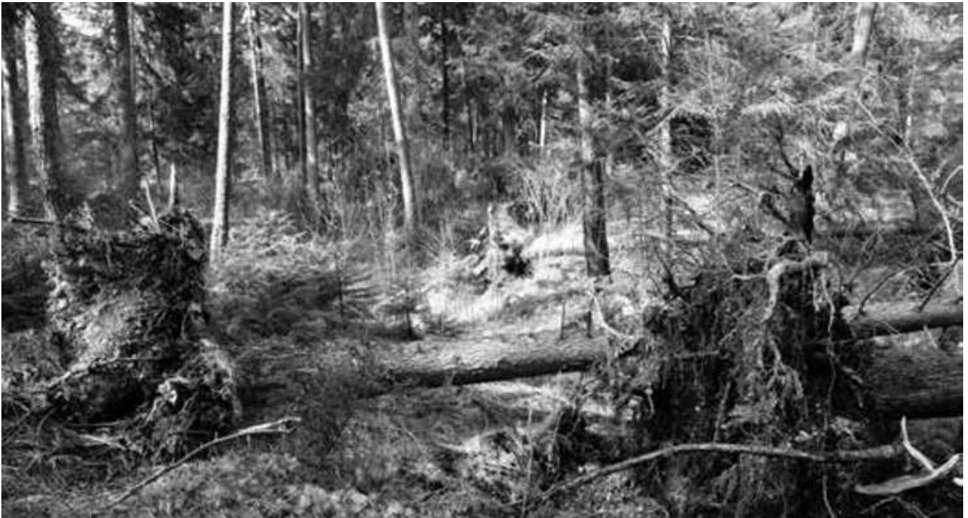
Am 31. März fegte Orkantief „Niklas“ über das Land