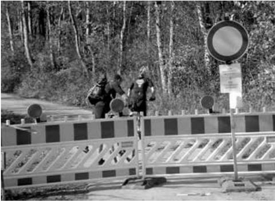
Hier wird eine professionelle Sperrung überwunden, als sei der ausdrückliche Hinweis auf Lebensgefahr ein besserer Witz

Nach der Bayerischen Verfassung und der nachgeordneten Gesetzgebung (Bayerisches Naturschutzgesetz, Waldgesetz für Bayern) gilt im