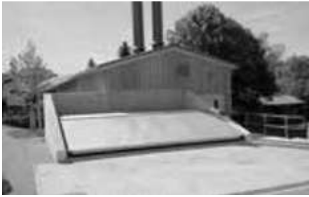
Heizhaus in Weyarn

Am 23.05.2015 wurde das neue Heizwerk in Weyarn mit einem großen Festakt und Gästen aus Politik und Wirtschaft eingeweiht. Alle interessierten