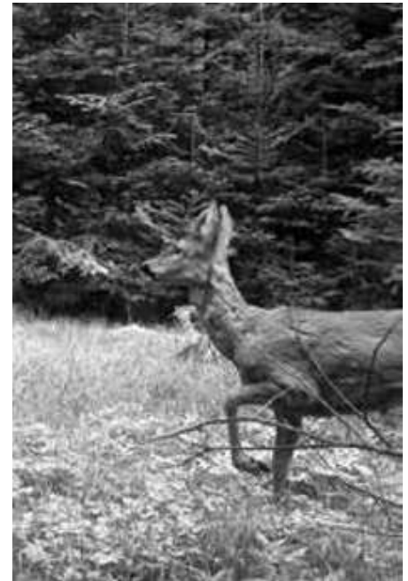
Für das Rehwild werden Abschusspläne mit dreijähriger Laufzeit erstellt

Die Förster der ÄELF konnten in diesen Wochen die Außenaufnahmen zum „Gutachten der Waldverjüngung 2015“ abschließen. Nun werden die Zahlen zusammengestellt und von den ÄELF im Laufe des Sommers an die Beteiligten verschickt und öffentlich vorgestellt. Erst anschließend erstellen die Ämter die eigentlichen Gutachten. Sie sind wichtige Grundlage für die gesetzlich vorgeschriebene Abschussplanung.