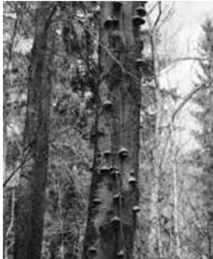
Totholz im Wald. Wichtiger Lebensraum für zahlreiche Tier- und Pflanzenarten.

Zum Waldnaturschutzjahr 2015 und zur Erinnerung an den 10. Todestag des BN-Mitglieds und Försters Alfred Osterloher lädt der BN in Zusammenarbeit mit dem Forstrevier Holzkirchen zum Taubenbergspaziergang ein. Im Mittelpunkt der Waldwanderung steht die Frage, ob eine multifunktionale Waldwirtschaft im Widerspruch zu den Belangen des Naturschutzes steht.