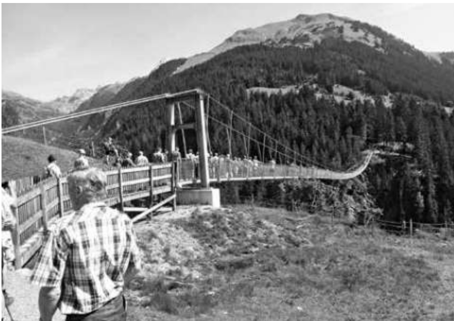
Moderne Hängebrücke in Holzgau

Schnell wird klar. Zum Schutz der Landwirtschaft muss es auf eine drastische Absenkung der völlig überhöhten ►