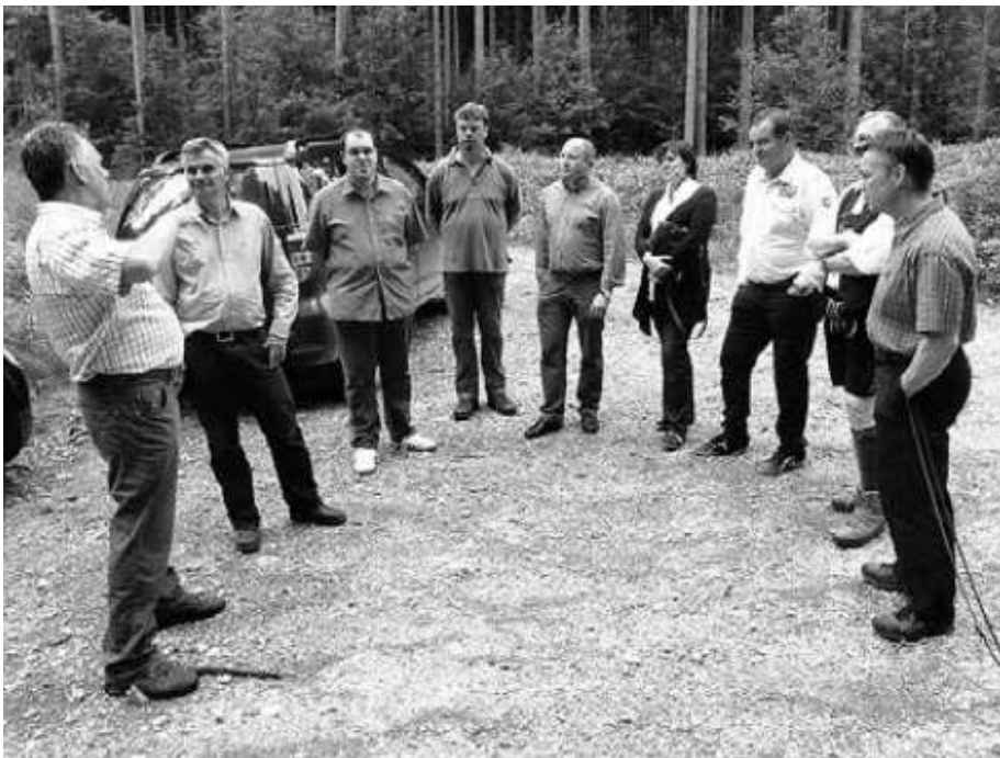
Die Landtagskandidaten im Gespräch mit Vertretern der WBV Holzkirchen

Wir hoffen, dass wir mit unserer Aktion dazu beigetragen haben, dass die Belange der Waldbesitzer und damit die unserer Mitglieder einen gewissen Stellenwert in der aktuellen politischen Diskussion erlangt haben. Jeder Waldbesitzer kann zudem die eingegangenen Stellungnahmen überprüfen und seine persönlichen Schlüsse daraus ziehen.