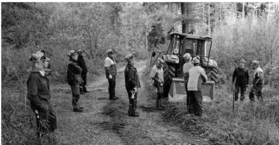
Die Teilnehmer des ersten WBV Seilwindenkurses

Die Unfallstatistiken der Berufsgenossenschaft zeigen, wie gefährlich das Arbeiten mit der Seilwinde ist. Nutzen Sie das kostenlose Angebot der WBV und melden Sie sich für einen eintägigen Seilwindenkurs an. Weitere Informationen zum Kursinhalt und -ablauf erhalten Sie in der WBV Geschäftsstelle. Sobald genügend Voranmeldungen vorliegen, wird wieder ein Kurs organisiert.